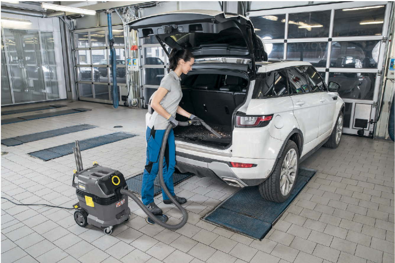
NT 30/1 Tact L