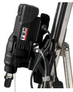
отверстие для контроля состояния сальников

Предохранительная фрикционная муфта может поглощать толчки и большие нагрузки. Данная муфта не основное средство защиты, а всего лишь вспомогательное устройство. Чтобы поддерживать муфту в хорошем состоянии, не следует допускать проскальзывание длительное время (максимум 1-2 секунды) в каждом случае. После сильного износа муфту необходимо подрегулировать или заменить в сервисном центре.