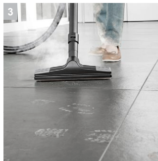
3 Удобная насадка для пола