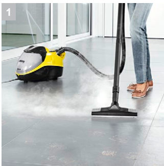
1 Аппарат 3 в 1

Функции паровой очистки, всасывания пара и сухого мусора - паропылесос Керхер SV 7 сочетает в себе все эти функции. Широкие возможности в одном аппарате!