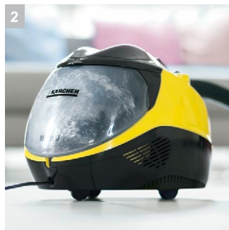
2 Многоступенчатая система фильтрации